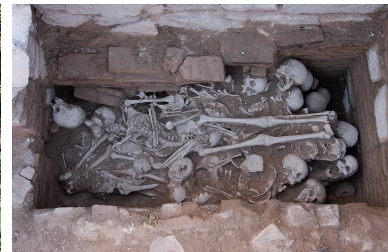
Grab mit Mehrfachbestattungen in der Hafennekropole