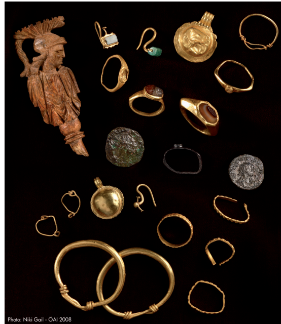
Beigaben aus einem Grabhaus in der Hafennekropole

In der archäologischen Forschung nimmt die Auseinandersetzung mit Nekropolen, also den Städten der Toten, eine besondere Stellung ein, gibt es doch kaum eine bessere Möglichkeit, dem antiken Menschen so nahe zu kommen wie an dem Ort seiner letzten Ruhe. So lassen sich anhand der menschlichen Überreste Aussagen zu Gesundheit, Ernährung, Lebenserwartung, Todesursachen und Verwandtschaftsverhältnissen treffen. Der Bestattungsplatz selbst, Bestattungssitten und Grabbeigaben erlauben Rückschlüsse auf den gesellschaftlichen Rang und die soziale Persönlichkeit des Verstorbenen. Die Nekropolenforschung geht