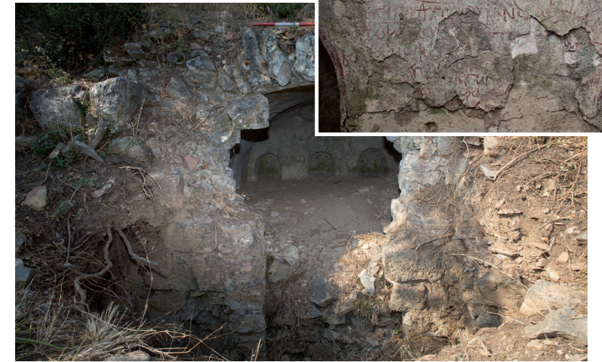
Grabhaus in der Hafennekropole mit Zitat aus Psalm 90

Seit dem Jahr 2008 werden in den Nekropolen von Ephesos mit Unterstützung des Fonds zur Förderung der wissenschaftlichen Forschung (FWF) intensive feldarchäologische Forschungen durchgeführt. Dabei kommt ein Methoden-Mix aus Surveys, Ausgrabungen, Geophysik, Geologie und Anthropologie zum Einsatz. Bis dato konnten ca. 90 ha konzentrierte Nekropolenareale um Ephesos nachgewiesen werden. In ihnen konnten wiederum mehr als 1.200 Grabstellen kartiert werden, die allerdings größtenteils bereits ab dem Ende der Antike Raubgräbern zum Opfer gefallen waren. Der überwiegende Teil der erhaltenen Gräber datiert in römische bis spätantik/frühbyzantinische Zeit, wobei ein Grab in Form eines frei stehenden Sarkophags oder als ein Grabhaus mit drei bis fünf Grablegen darin charakterisiert ist. In ihnen sind Mehrfachbestattungen über meh-