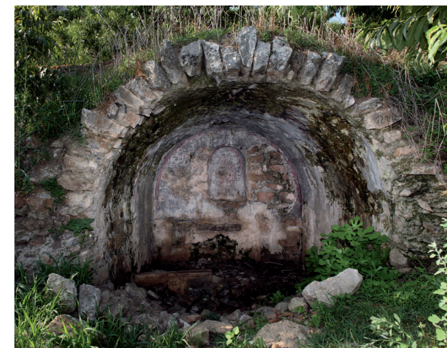
Grabhaus mit spätantiken Malereien in der Südostnecropole

nahme gesehen, durch die der Leichnam aus dem Wohnbereich entfernt und außerhalb der Siedlung verbrannt oder beigesetzt werden sollte. Gemäß seiner griechischen und später christlichen kulturellen Identität überwiegen in Ephesos Körperbestattungen gegenüber Brandbestattungen bei Weitem. Die Bestattung innerhalb der Stadtmauern galt als Ausnahme und großes Privileg und kam nur hochverdienten Persönlichkeiten – zu meist Mäzenen wie etwa Celsus oder Aristion – zugute.