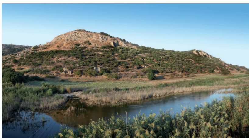
Grabhäuser am Hang unter dem sog. Paulusgefängnis (Hafennekropole)