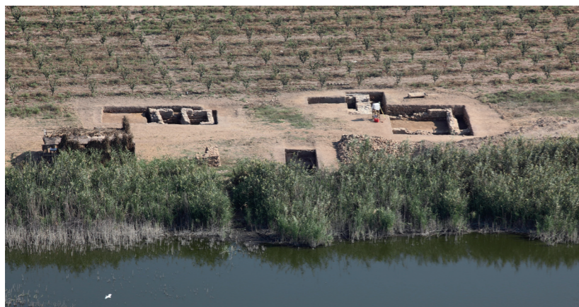
Ausgrabungen in der Hafennekropole