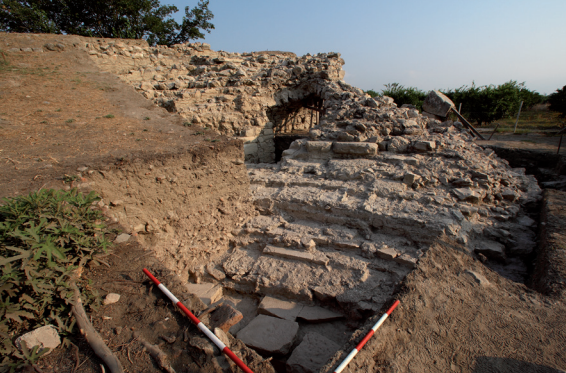
Halbkreisförmiger Zuschauerraum (Cavea)