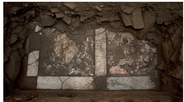
Geometrischer Marmorbelag des Orchestrabodens (Opus sectile)

sogenannten Tribüne als überdachtes Odeion nahe. Die Lokalisierung der Bühne sowie die Freilegung des Orchestrabodens aus opus sectile (Anm. d. Red.: Technik, durch die verschiedene Materialien in Wände oder Fußböden eingelegt wurde) lassen nun keinen Zweifel mehr an dieser Interpretation: Es handelt sich um das Odeion, das Austragungsort der inschriftlich überlieferten musischen Agone zu Ehren der Göttin Artemis war. »