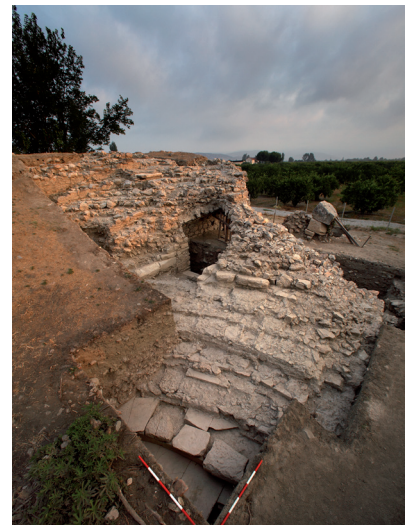
Halbkreisförmiger Zuschauerraum (Cavea)

Forschungen im Artemisheiligtum von Ephesos beinhalten seit jeher auch die Dokumentation beraubter Gebäudestrukturen. Besonders der Bereich unmittelbar um den Tempel, der selbst bis in seine Fundamente beraubt wurde, war vom systematischen Abbau der antiken Bausubstanz betroffen. Umso erfreulicher sind die Ergebnisse des aktuellen Projekts zur sogenannten Tribüne im Artemision, das vom Österreichischen Archäologischen Instituts (ÖAI) finanziert wird. Die Auswertungen zeigen, dass es im heiligen Bezirk der Artemis sehr wohl noch Gebäude in besserem Erhaltungszustand gibt.