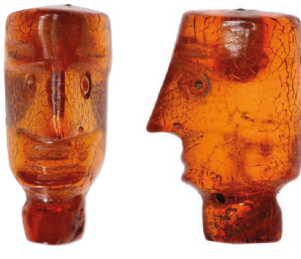
Menschlicher Kopf, vermutlich Bekrönung einer Gewandnadel

Form und Größe sehr und gehörten vermutlich zu einem einzigen prachtvollen Schmuckstück. Dieses setzte sich aus mehreren Strängen von Perlen und Anhängern zusammen, die von den Schiebern in Form gehalten wurden. Form und Machart der Bernsteinobjektbestimmen eng mit Perlen, Anhängern und Schiebern aus Südalien überein. Dort wurde Bernsteinschmuck unter der lokalen Bevölkerung der Oinothra, die in der heutigen Basilika lebten, ab dem späten 8. Jahrhundert v. Chr. sehr beliebt. Weibliche Bestattungen der oinothrischen Elite enthielten Halsketten, Pektoreale und Gürtel. Bei ungestörten Gräbern lagen sie noch in ihrer ursprünglichen Position auf dem Sinekett, sodass die komplexen, vieltteiligen Schmuckstücke rekonstruiert werden konnten. Die prachtvollsten Schmuckstücke oinothrischer Adelige bestanden aus Hunderten kleinen Einzelelementen, die in mehreren Reihen über- und nebeneinander angeordnet waren. Ein solch komplexes, prächtiges Schmuckstück war vermutlich auch in dem Hort unter dem Naos 1 deponiert worden – dafür spricht die große Zahl gleichartiger Einzeleite. Am wahrscheinlichsten ist, dass es sich bei diesem aufwendigen