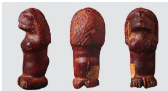
Statuette einer Frau, die die Göttin Artemis oder eine Weihende darstellt