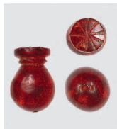
Anhänger aus Bernstein