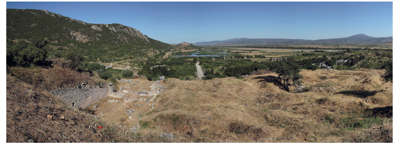
Abb. 2: Blick von der Palastanlage oberhalb des Theaters auf Unterstadt und Hafenebene