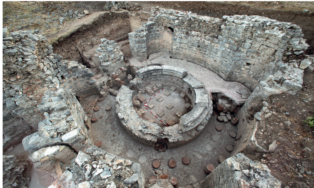
Abb. 4: Nischen-Zentralraum mit kreisrundem Umgang um Wasserbecken, in das nachträglich Hypokaustpfeiler gesetzt wurden

gen Badeanlage ausgebaut wurde. Auch der Bau eines lang gestreckten Saals für sakrale und/oder politische Versammlungen auf einer mächtigen Plattform unmittelbar südlich des Palasts könnte mit dem Palastkomplex in enger funktionaler Verbindung gestanden haben.