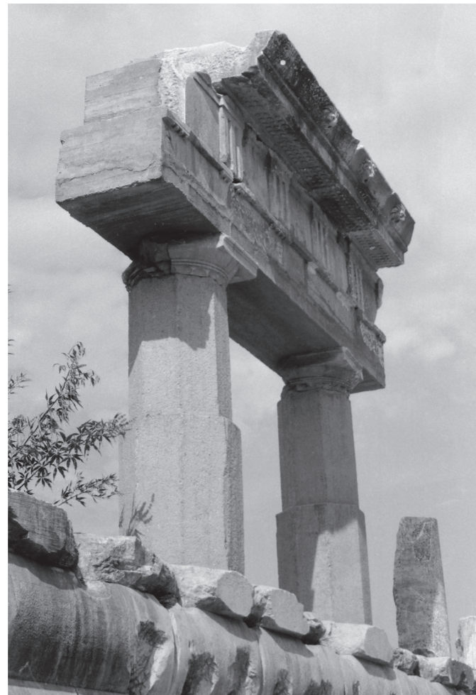
Wiederaufbaumaßnahme entlang der Marmorstraße. Originale Bauteile der »Neronischen Halle«, versetzt auf Betonelementen, 1955 (ÖAI-ÖAW)

Die ersten Besucher von Ephesos fanden noch eine natürliche Ruinenlandschaft vor. Doch bereits zu Beginn des 20. Jahrhunderts war durch Suchgräben im gesamten Areal und die Freilegung einzelner Monumente der Eingriff in die Landschaft und somit eine