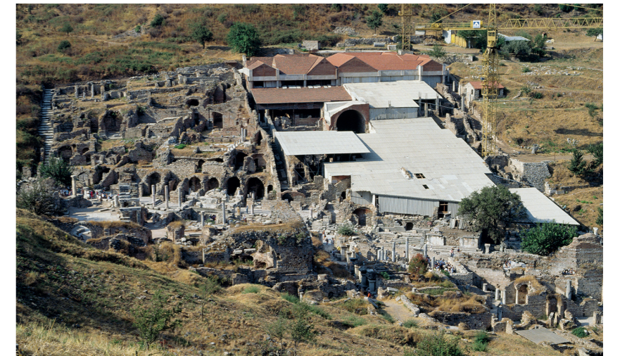
Situation südlich der Kuretenstraße bis ca. 1999. Nicht überdachtes Hanghaus 1 (links) und überdachtes Hanghaus 2 (rechts), die 1985 fertiggestellte Überdachung der Wohnheiten 1 und 2 sowie der provisorische Schutz der restlichen Wohnheiten

Heutiges Erscheinungsbild der Kuretenstraße; teilweise wiederaufgebaute, restaurierte und überdachte Bauten entlang dieses Hauptbesucherweges des Archäologischen Parks, 2009