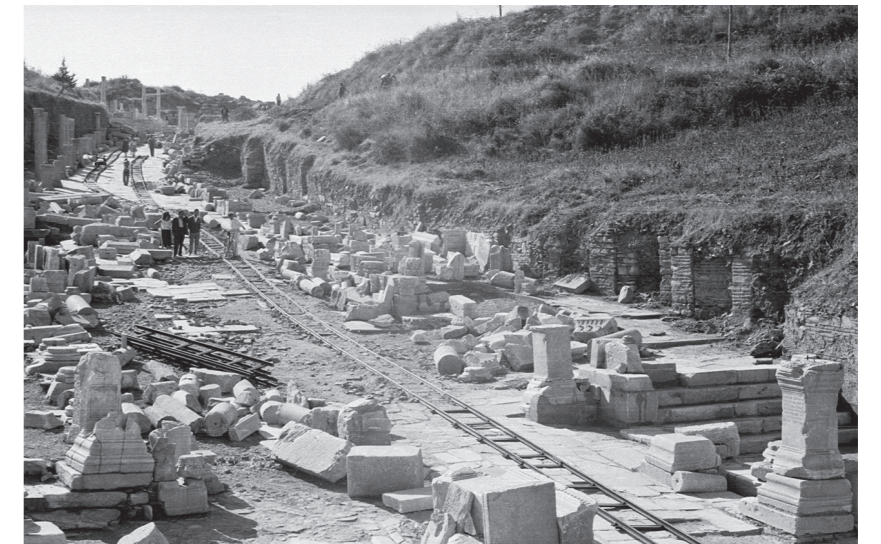
Die Kuretenstraße während der Freilegungsarbeiten, ca. 1960 (ÖAI-ÖAW)